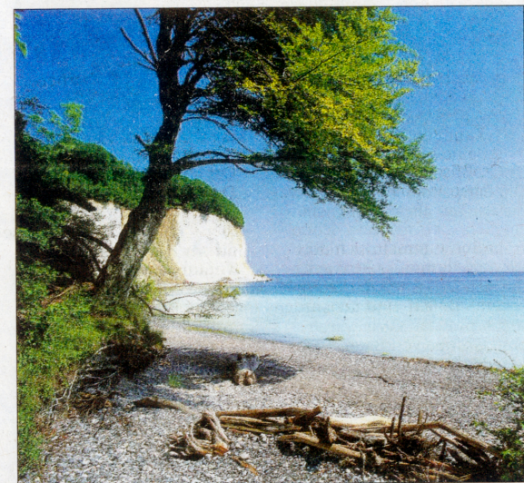
Steinstrand unter Kreidefelsen – die Landschaft im Nationalpark Jasmund auf Rügen macht Appetit auf mehr.